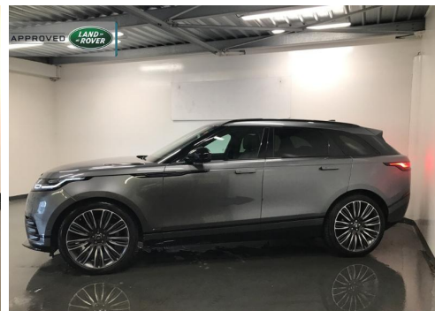
■ GROUPE DUFFORT