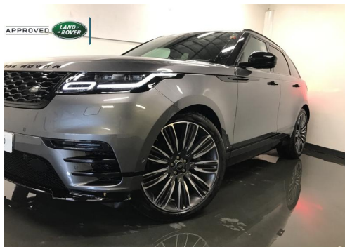
■ GROUPE DUFFORT