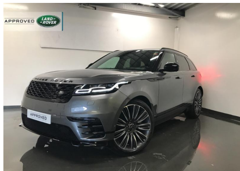
■ GROUPE DUFFORT