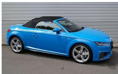
Autohaus | Kröninger