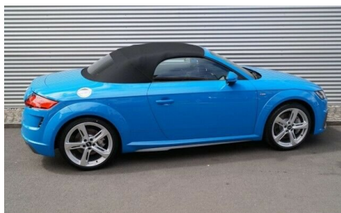
Autohaus | Kröninger